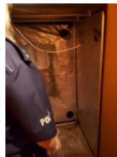
Policjanci zabezpieczyli prawie 300 g marihuany i zlikwidowali domową plantację

Właściciel tej mini plantacji (25l.) został zatrzymany i dowieziony do komisariatu. Tam usłyszał zarzuty z ustawy o przeciwdziałaniu narkomanii i odpowie za wytwarzanie oraz posiadanie środków odurzających, za co grozi mu kara do 3 lat pozbawienia wolności. Sprawa niebawem trafi do sądu.